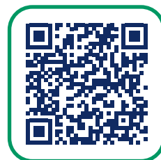
Quello che conta Portale nazionale