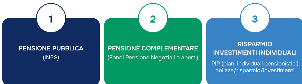
Figura 1 - Schema dei tre pilastri