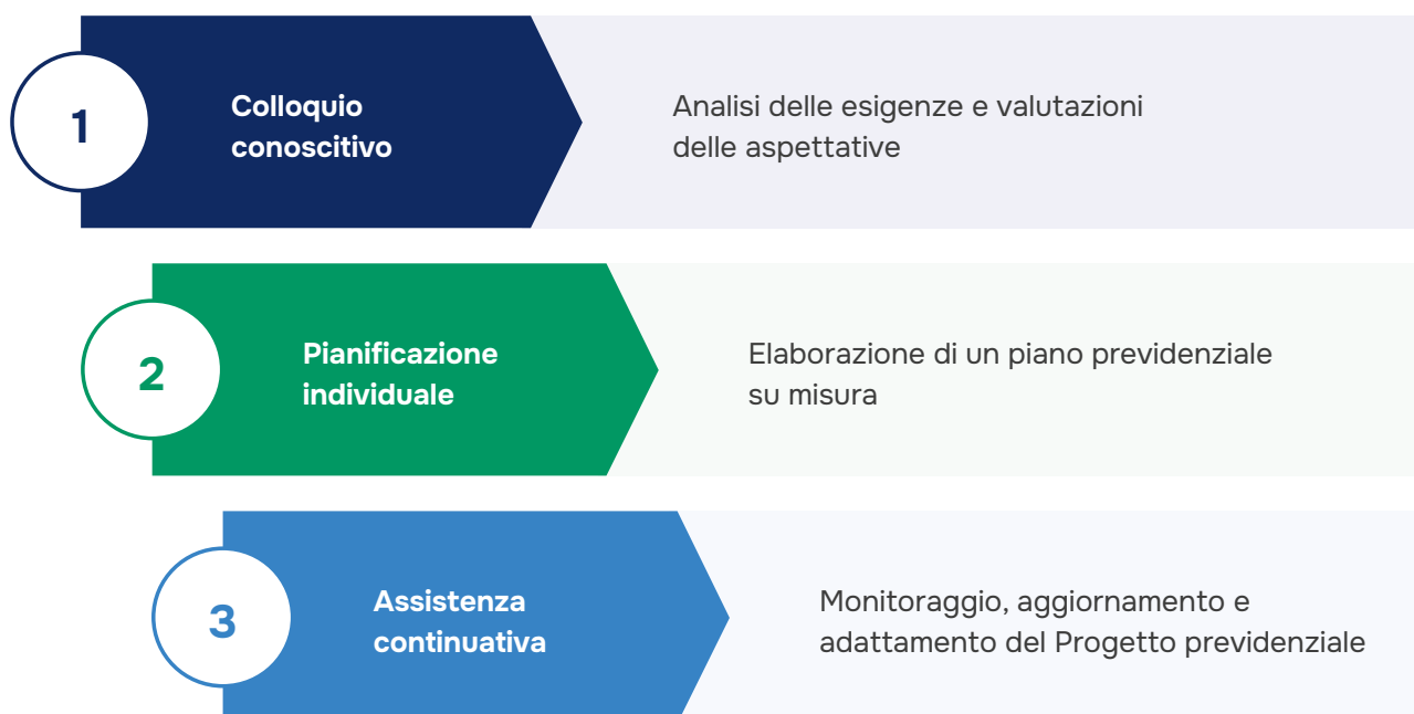
Figura 3 - Individuazione del Fabbisogno Previdenziale

L'individuazione del fabbisogno previdenziale avviene attraverso tre fasi: